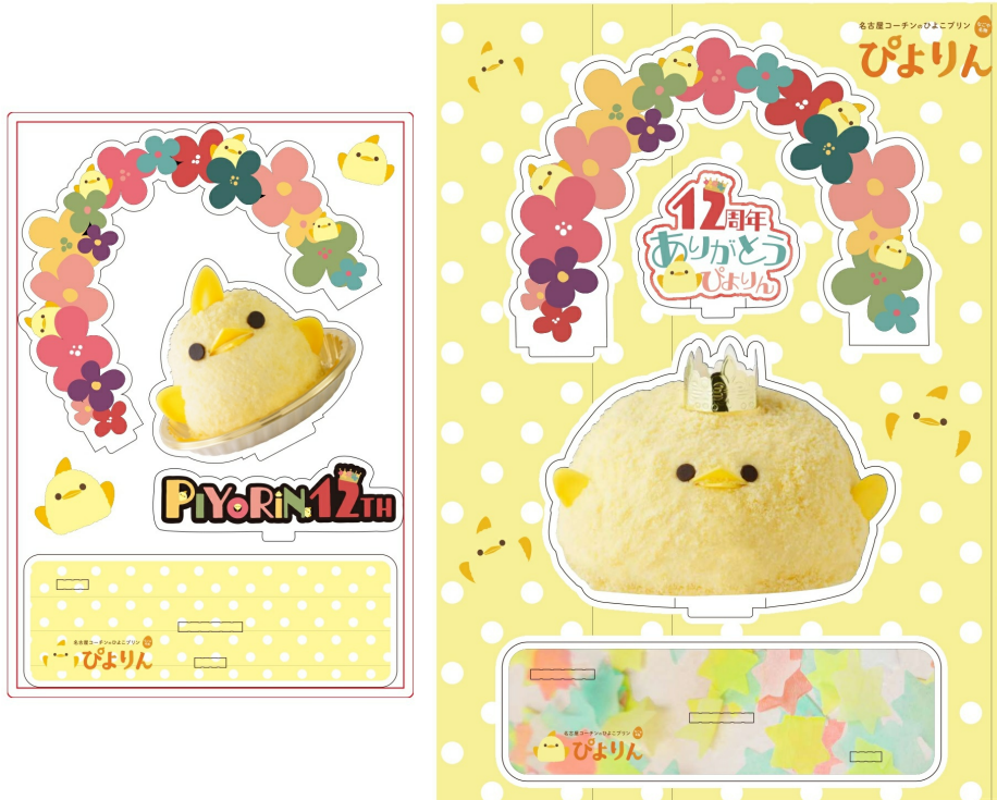
ぴよりん12周年記念アクリルスタンド

販売箇所：ぴよりんMARKET https://market.jr-central.co.jp/shop/c/cpiyorin/