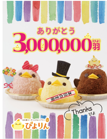
300万羽記念ステッカー