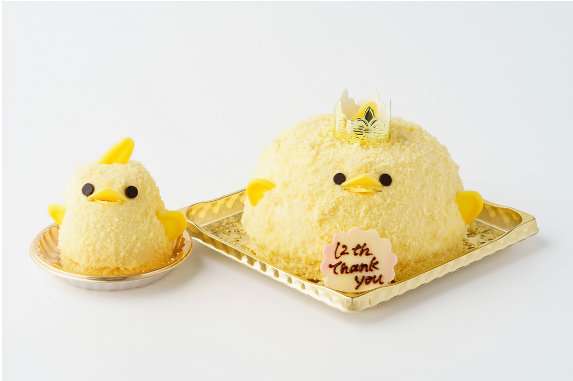
ぴよりんとの比較